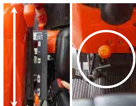
Palanca de rango de cambios